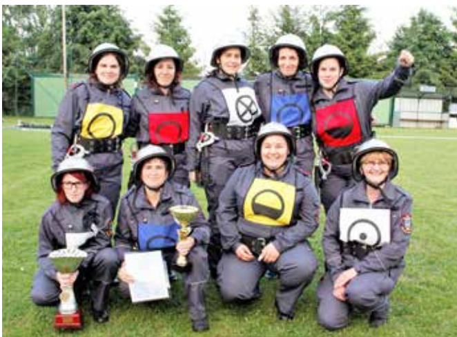
Zmagovalke PGD Kovačevci