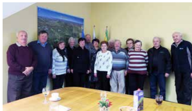
Vodstvo DU Grad na sprejemu pri županji

Člani upravnega odbora ne trkajo na vrata le takrat, ko pobirajo članarino, ampak tudi takrat, ko prinašajo voščila in darila v prednovoletnem času, ob okroglih obletnicah ali pa kar tako, da malo poklepetajo in popestrijo vsakdan tistim, ki potrebujejo njihovo družbo. Še posebej so pozorni do 80-letnikov. Te počastijo z malo pozornostjo na naslednjem občnem zboru po dopolnjenem 80. letu.