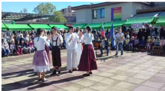
Z domačimi plesi se je predstavila tudi starejša folklorna skupina