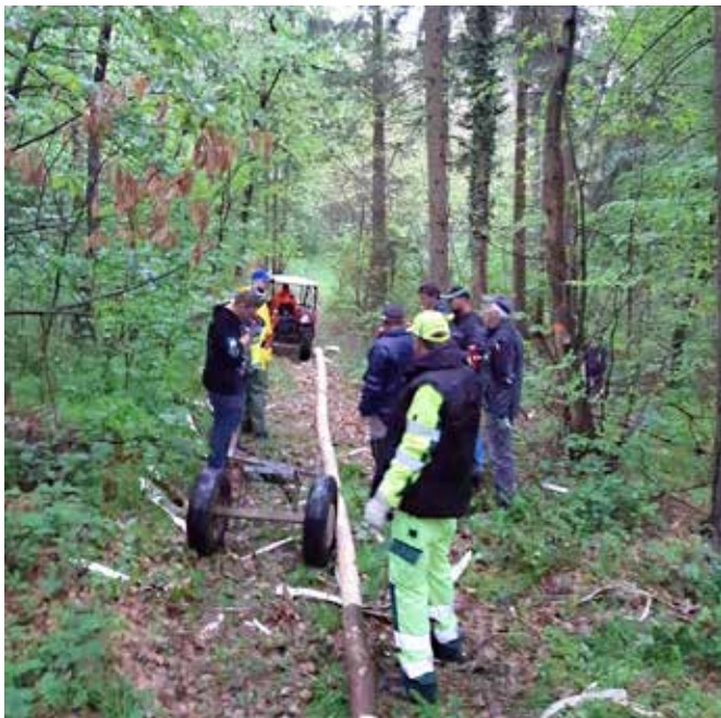
Iskanje mlaja