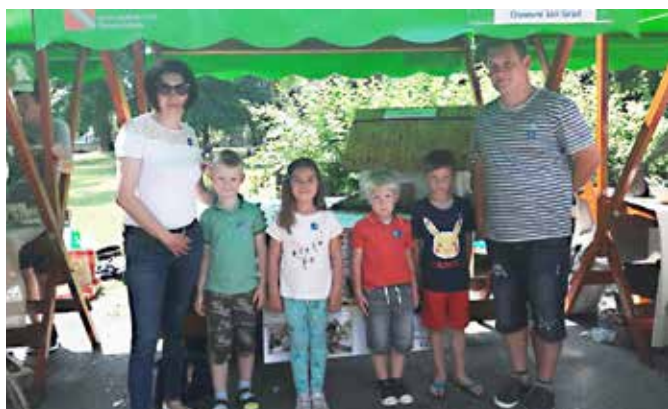
Predstavitve v Murski Soboti