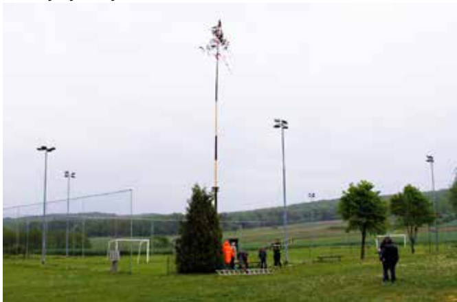
Živel prvi maj