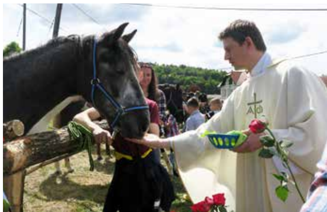
Blagoslov konjev, da bodo zdravi in bodo dobro služili svojemu gospodarju.

Mihaela Žökš, dipl. upr. org. Strokovna sodelavka za družbene dejavnosti