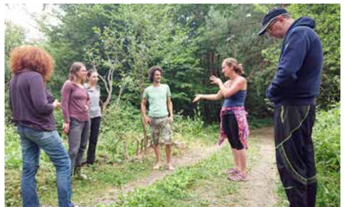
Permakultura na Goričkem 2019