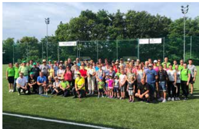
Pohodniki 2019 Vidonci