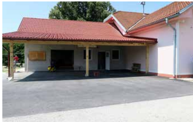
Asfaltiranje platoja pred gasilskim domom v Kruplivniku