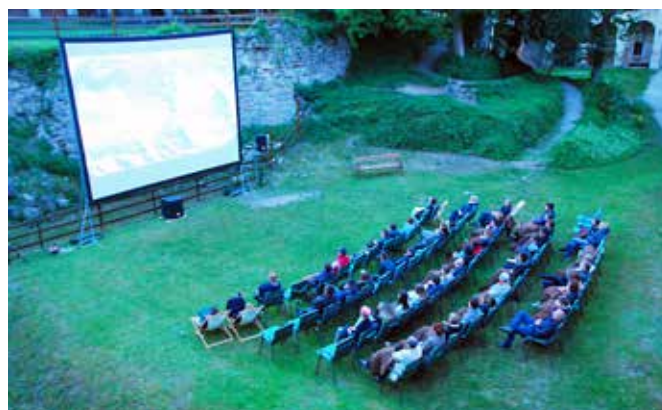
Kino pod zvezdami