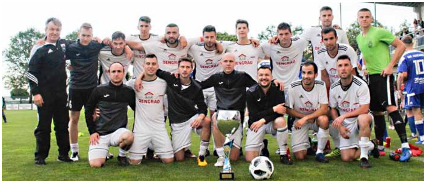
NK GRAD PRVAK