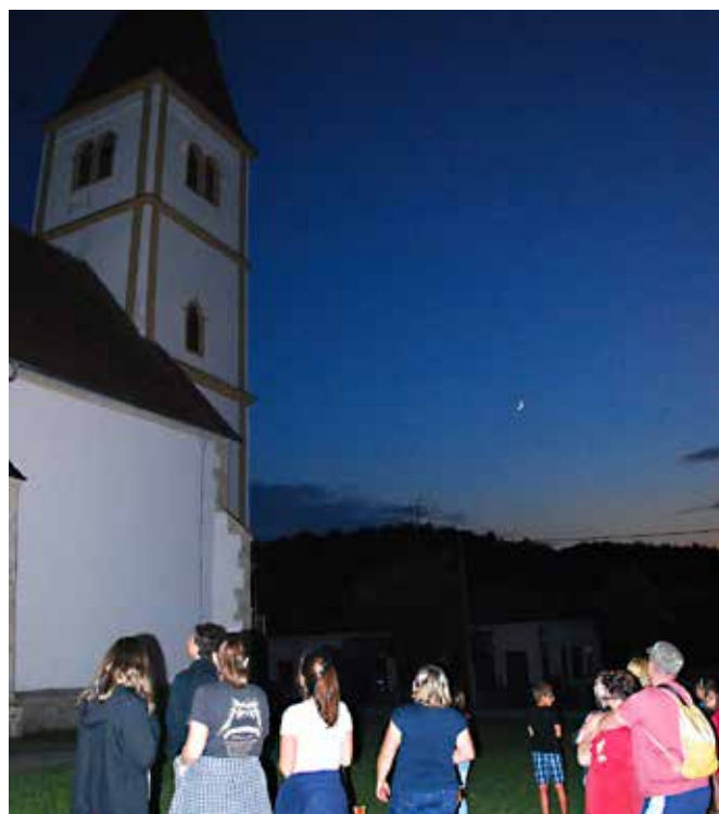
Opazovanje izletavanja navadnih netopirjev iz cerkve Marijinega vnebovzetja pri Gradu