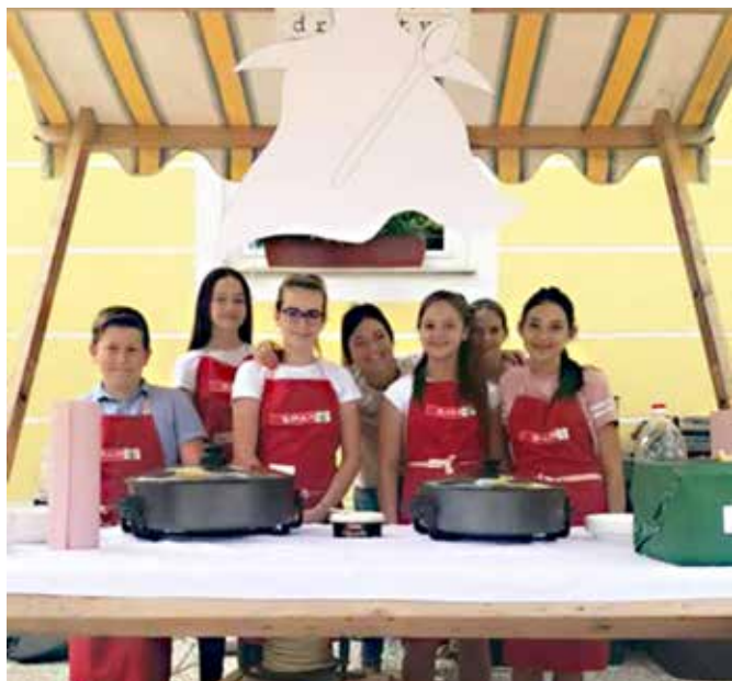
Člani krožka kuharija, ki so obiskovalcem ponujali langaš in prekmursko gibanico