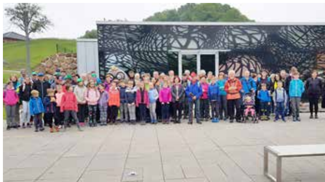
Pohodniki na 4. pohodu po Olikevi vulkanski poti

Letos smo krenili proti severu in se najprej ustavili v kamnolomu bazaltne tufa, kjer smo si ogledali dva kratka filma o olivinu in delu v kamnolomu nekoč. Nato smo se podali na severno steno kraterja, od koder se nam je odprl lep razgled na celoten krater in južno steno, ki jo je izbruh vulkana podrl, material pa se je izlil proti jugu, torej proti Belemu križu. Tu smo imeli tudi prvo postojanko z okrepčilom. Pot smo nadaljevali po vzhodni steni kraterja do gradu Grad in se nato povzpeli na manjši krater, kjer stoji Kripta. Po spustu s kraterja smo nadaljevali pot mimo Marofa in skozi Pörgo nazaj do Vulkanije. Pot smo zaključili v