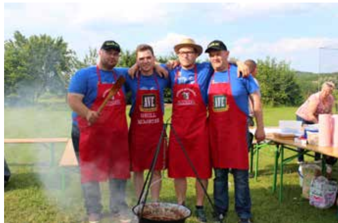
Letošnji zmagovalci