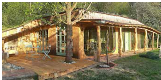
Najnovejša pridobitev na posestvu je zemljanka – luksuzni apartma ANIKA, poimenovan po nekdanji sosedki, ki je živela na kraju, kjer zemljanka stoji.

Hrane za zdaj ne ponujajo, temveč tovrstno ponudbo kombinirajo z okoliškimi gostilnami.