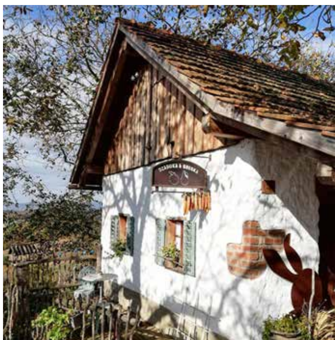
Apartmenti Džaboka in Gruška so urejeni v tradicionalni prekmurski hiši.