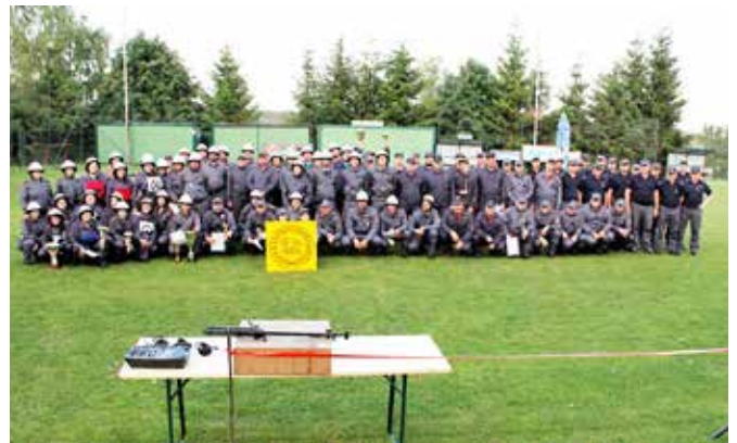
Občinsko gasilsko tekmovanje 2019