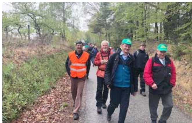
Pohodniki po Kruplivniku