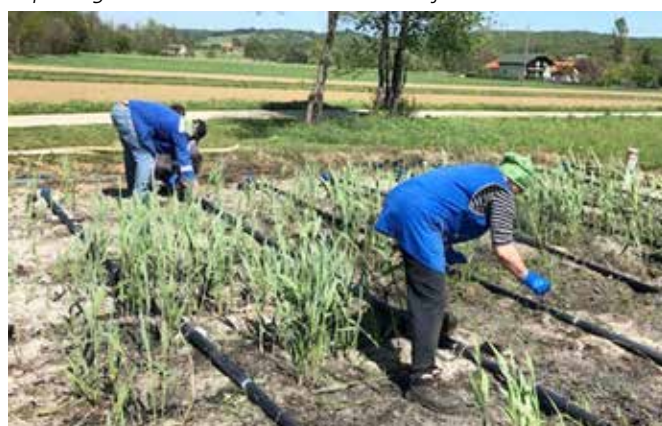
Čiščenje grede na rastlinski čistilni napravi v Motovilcih