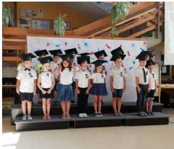
Bodoči prvošolčki