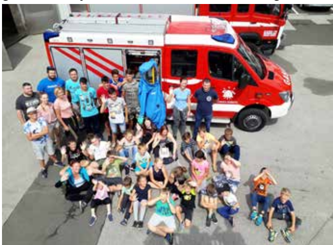
Ogled PGD Murska Sobota

V soboto so nas zjutraj pričakali gasilski kombiji naše gasilske zveze in odpravili smo se na izlet. Obiskali smo PGD Murska Sobota. Tam sta nas pozdravila predsednik in poveljnik društva, gasilci pa so nam predstavili njihov vozni park in opremo. Za presenečenje smo se dvignili z gasilsko lestvijo nad mesto Murska Sobota. Po ogledu smo