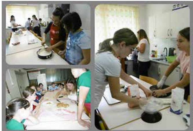
Tako so nastajale francoske jedi

Z učenci, ki so v šolskem letu 2018/2019 obiskovali tuje-jezični klub in kuharijo, smo sodelovali v mednarodnem projektu So schmeckt Europa. Poleg naše so v projektu