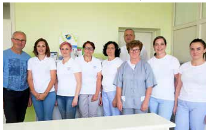
Trenutno osebje v Zdravstveni postaji Grad

V času službovanja dr. Mikliča pri Gradu, pa tudi po njegovi zaslugi je bil leta 1969 zgrajen nov zdravstveni dom pri Gradu. V novem zdravstvenem domu je bila zdravstvena