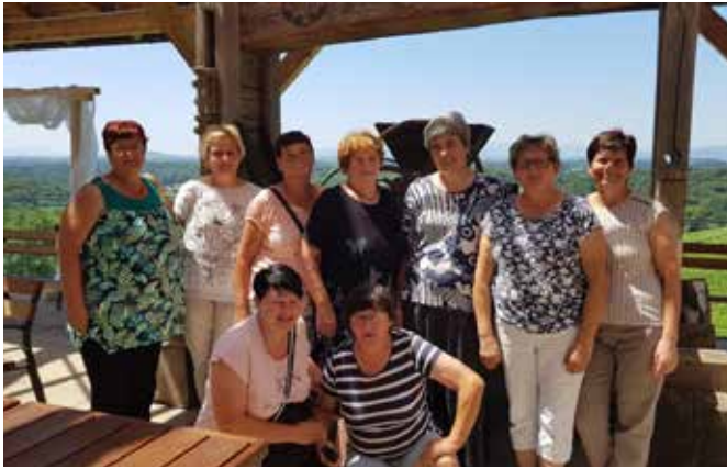
Članice DŽD Kruplivnik na skupnem druženju