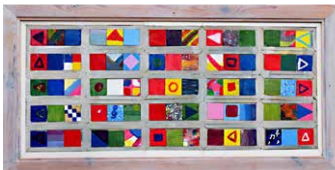
Pisana paleta barv in občutkov na naši novi sliki