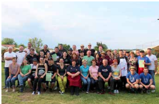
Kuharji 2019