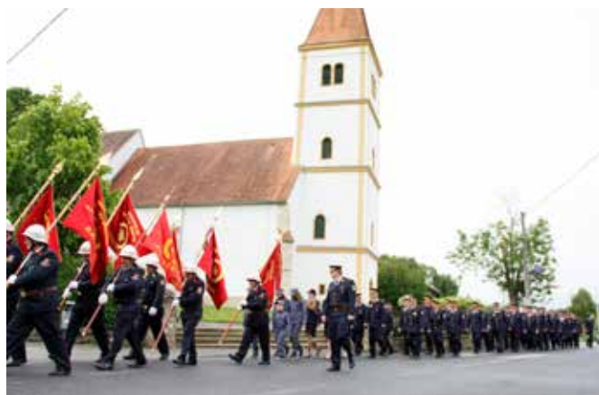
Slovesni mimohod po Pörgi do gasilskega doma Grad na skupno kosilo

Mihaela Žökš, dipl. upr. org. Strokovna sodelavka za družbene dejavnosti