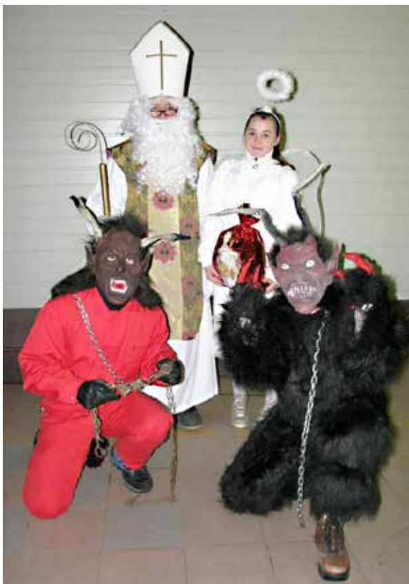
So edini v občini, ki še vedno držijo stari pristni običaj – obisk sv. Miklavža od hiše do hiše.