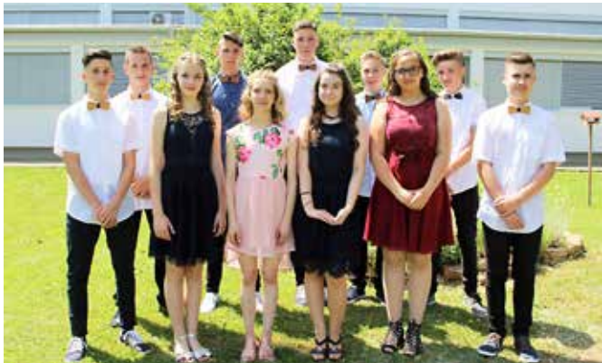
Valeta 2019