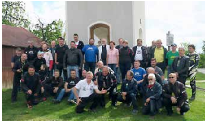
Spominska skupinska slika, Moto Cimešter 2019