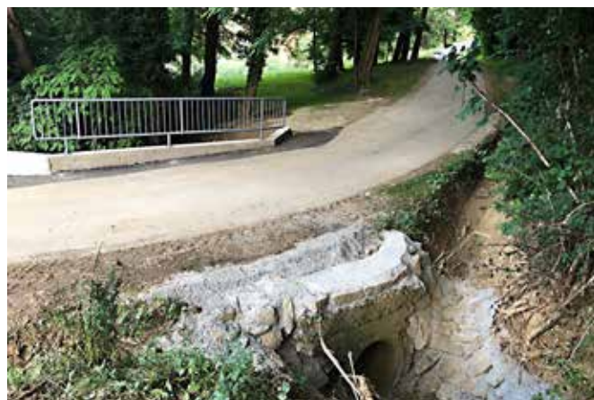
Sanacija mostu pri Lojzki v Radovcih