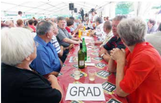
Udeležilo se jih je 47. Imeli so organiziran skupni prevoz.