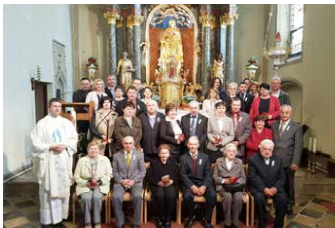
Zakonci jubilanti 2019