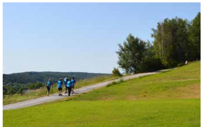
Pohodniki po lepi pokrajini

Drugo nedeljo v juniju, na binkoštno nedeljo, 9. junija 2019, v dopoldanskih urah, je po Dolnjih Slavečih potekal tradicionalni binkoštni pohod. Pohod je organiziralo ŠRD Dolnji Slaveči. V vroči sončni nedelji so se pohodniki podali na zarisano traso ter uživali v naravi, čeprav je sonce močno grelo naša telesa. Start in cilj se je kot vedno odvijal v prostorih gasilskega doma na Dolnjih Slavečih, vmes pa smo poskrbeli za dve postojanki, kjer so se lahko pohodniki okrepčali s pijačo in prigrizki. Pohoda se je udeležilo okrog 100 pohodnikov iz domačih in tujih krajev, večji de-