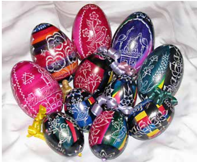
Vsi motivi so izdelani natančno.

Za svoje izdelke je pri Obrtni zbornici Slovenije pridobil naziv izdelek domače obrti, na natečaju za najboljše rokodelske izdelke Goriškega pa je zanje dobil posebno priznanje. Ima certifikat Rokodelstvo Art&Craft Slovenija. Je imetnik Kolektivne blagovne znamke Krajinski park Goričko za izdelke. Občasno je imel tudi delavnice izdelovanja remenk na okoliških šolah.