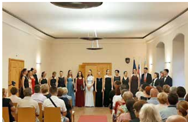
Zaključni koncert oddelka za petje Glasbene šole Murska Sobota