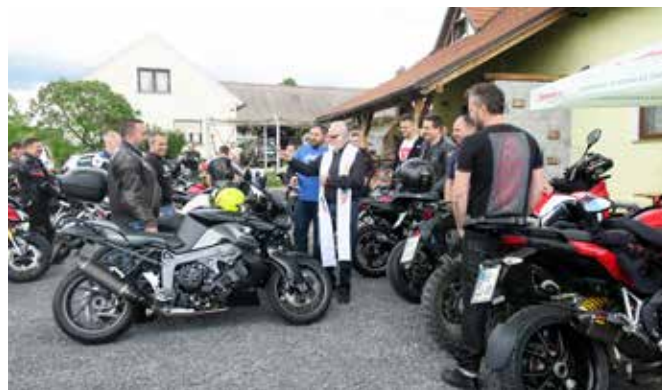
Blagoslov motorjev in voznikov za srečno vožnjo