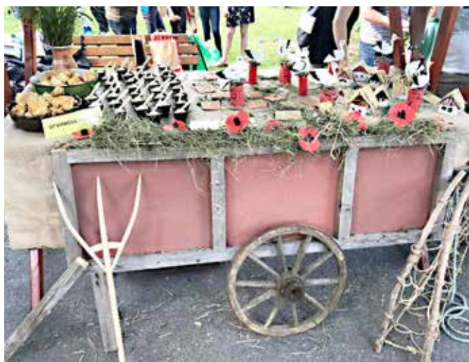
Stojnica je poudarjala vonj po Prekmurju.

V okviru praznovanja 100-letnice priključitve Prekmurja in združitve prekmurskih Slovencev z matičnim narodom je v četrtek, 6. junija 2019, od 10. do 14.30, na ploščadi pred gradom in v mestnem parku v Murski Soboti potekal Festival inovativnosti in ustvarjalnosti v organizaciji območne enote Zavoda Republike Slovenije za šolstvo Murska Sobota. V programu je sodelovala tudi Osnovna šola Grad. Pripravili so stojnico, s katero so želeli poudariti prekmurski vsakdanjik in kulinariko. Predstavili so tudi pevsko točko, ki je bila del kulturnega programa.