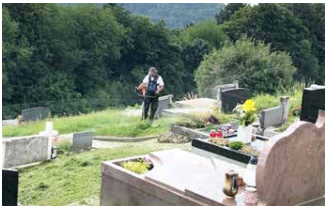
Košnja vseh 8 pokopališč v občini