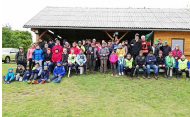
Pohod Kovačevci 2019