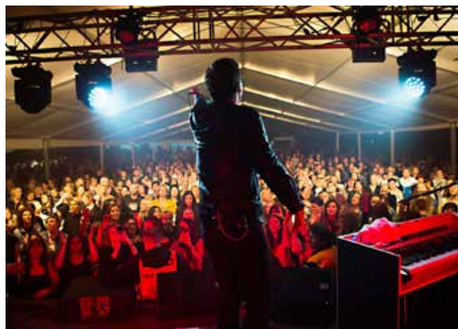
Jan Plestenjak

Evangelikičanska cerkvena občina Bodonci je v soboto, 25. maja, na igrišču Podružnične osnovne šole Bodonci organizirala dobrodelni koncert priljubljenega slovenskega pevca Jana Plestenjaka.