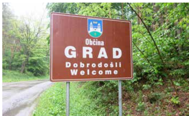
Table označujejo začetek Občine Grad.

Mihaela Žokš, dipl. upr. org. Strokovna sodelavka za družbene dejavnosti