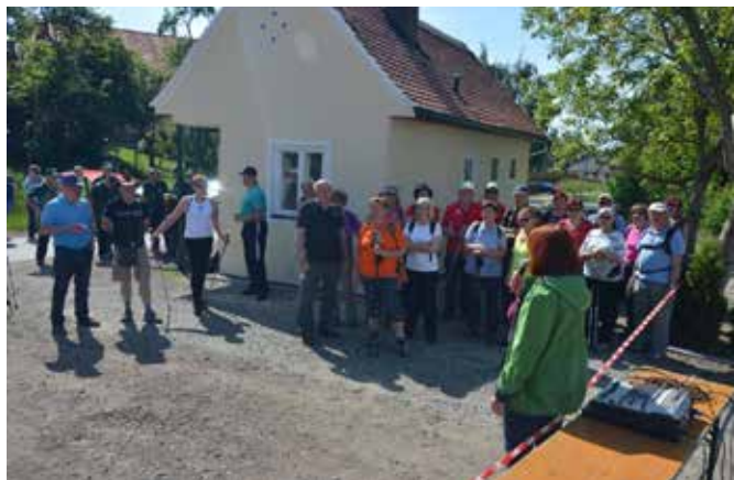
Pozdravni nagovor na startu pohoda

Po daljšem počitku, malici in druženju smo se vrnili nazaj do našega izhodišča in skupaj prehodili 11 km ter spoznali,