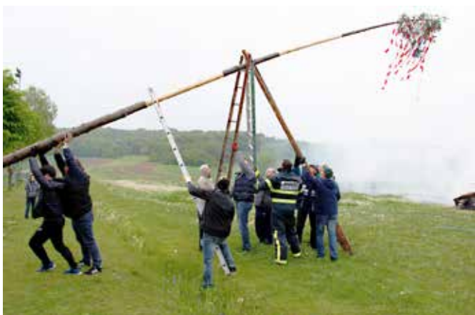
Postavljanje mlaja