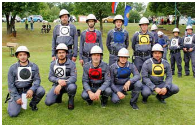
Aktivna desetina

Občina Grad podela PGD Kruplivnik za 80 let delovanja društva Priznanje Občine Grad. Za dolgoletno nesebično pomoč in prostovoljno delo na področju gasilstva, prostovoljstva in človekoljubnih dejavnosti, kot tudi za zavzeto medsebojno sodelovanje vaščanov in gasilskega društva pri različnih družbenih aktivnostih v vasi Kruplivnik in na območju Občine Grad.