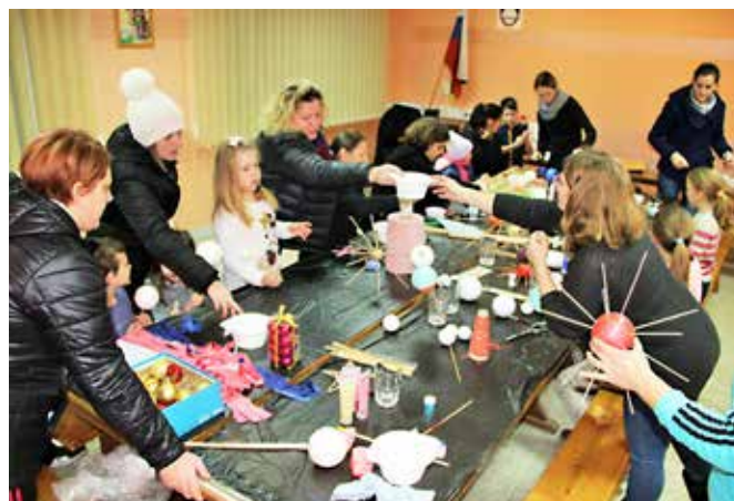
Člani se družijo in skupaj oblikujejo dogajanje v svoji vasi – izdelovanje okraskov za jelko.