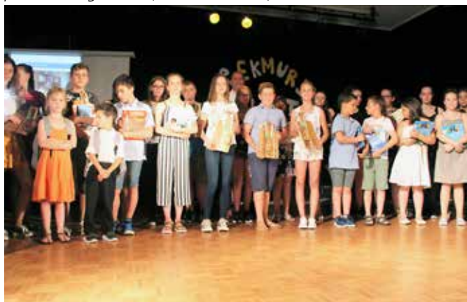
Nagrajeni so bili tudi uspešni učenci OŠ Grad