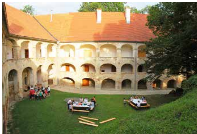
Izdelovanje netopirjev iz papirja in sestavljanje netopirnic

Ali se netopirji zapletajo v lase? Ali netopirji napadajo ljudi in jim pijejo kri? Takšne in podobne neresnične vraže so netopirjem naredile veliko škode. Pregarjati so jih začeli iz kleti in podstrešij in na odprtine v stavbah z zatočišči netopirjev nameščati mreže. Zato se je njihovo število začelo zmanjševati. Ne zavedajoč se, da ti edini, aktivno letiči sesalci pri nas, spadajo med najpomembnejše živalske skupine za človeka, saj z lovljenjem nočno aktivnih žuželk vplivajo na njihovo številčnost. Določene vrste netopirjev si za domovanja izbirajo mirna in temnejša mesta v stavbah, zato je naš pozitiven odnos do njih še toliko pomembnejši. Eno izmed njihovih najpomembnejših zatočišč v vzhodni Sloveniji predstavlja grad Grad, zato smo se v Javnem zavodu Krajinski park Goričko odločili, da netopirjem posvetimo dogodek, ki smo ga poimenovali »Preživi večer z netopirji na gradu Grad na Goričkem«. Na dogodku 5. julija 2019 so tako otroci lahko iz papirja izdelovali netopirčke in iz lesa sestavljali netopirnice, ki jih bodo namestili doma na