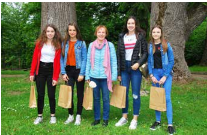
Finalistke v grajskem parku

Goričkemu najbližje biosferno območje (območje z visoko naravno in kulturno vrednostjo v svetovnem merilu) povezuje pet držav, ki so se zavezale k varovanju tega izjemnega življenjskega okolja. Ob prihodu smo utrdili znanje o tujerodnih invazivnih vrstah, ki smo jih ob reki našli kar nekaj. Sledila je vožnja z rafti od Kroga do Ižakovcev, ki je bila nepozabno doživetje. Vmes smo se izkrcali pri plavajočem Babičevem mlinu v Veržeju. Pozdravil nas je mlinar Mirč,