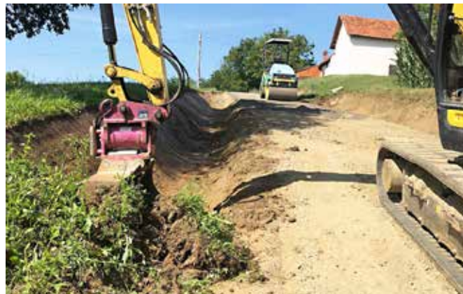
Sanacija ceste pri Gradu v Bežanovi grabi