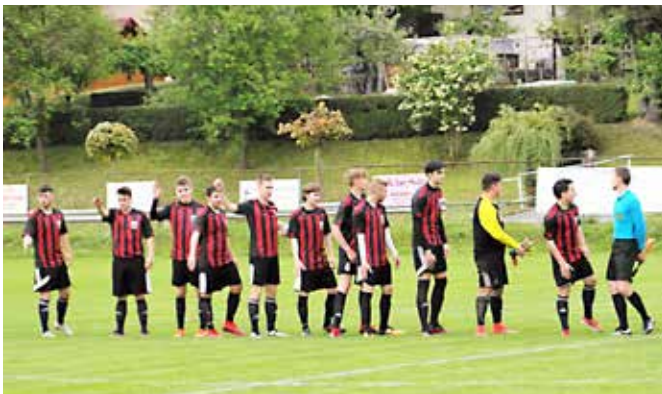
Mladinci NK Grad