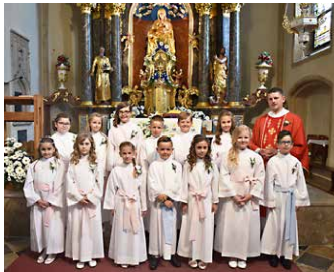
Prvoobhajanci 2019