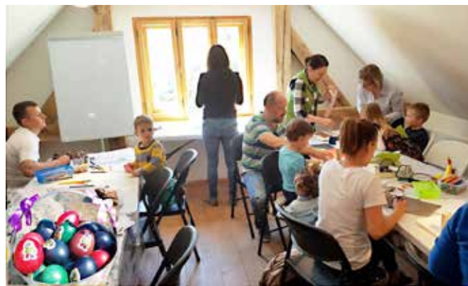
Na delavnici so si otroci izdelali velikonočne okraske