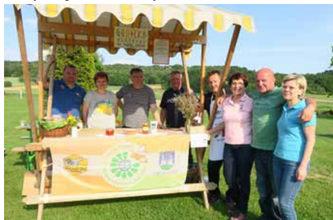
Svoje spretnosti v kuhanju bograča je pokazala tudi županja s svojo ekipo. Ekipa »Gračka vlada« je na koncu osvojila 3. mesto.