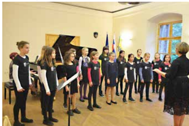
Otroški pevski zbor Glasbene šole Murska Sobota