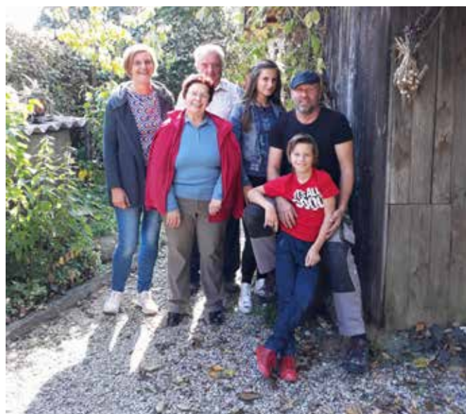
Družina Časar