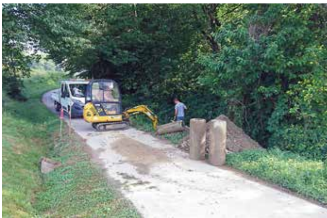
Ureditev večjega propusta čez cesto v Radovcih