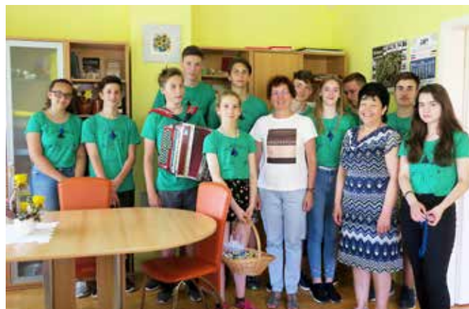
Devetošolci pri županji

Mihaela Žokš, dipl. upr. org. Strokovna sodelavka za družbene dejavnosti