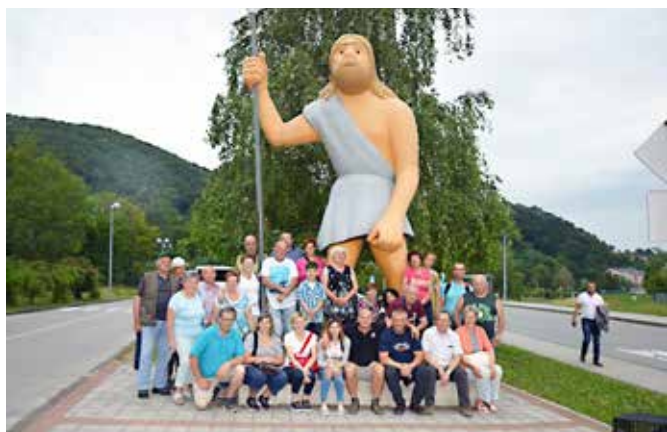
V Krapini