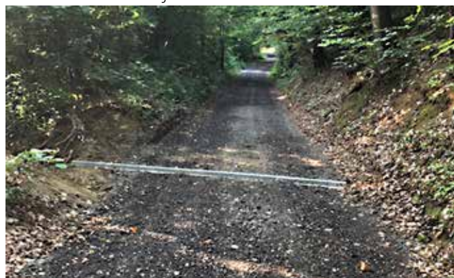
Navoz ceste Anikina graba Kruplivnik - odvodnjavanje čez cesto urejeno s kovinskimi elementi