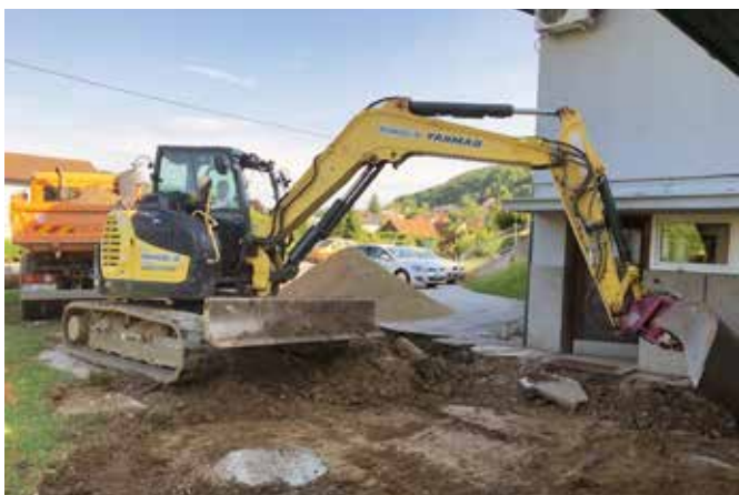
Ureditev parkirišča pri Zdravstveni postaji Grad