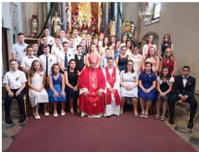
Birmanci 2019