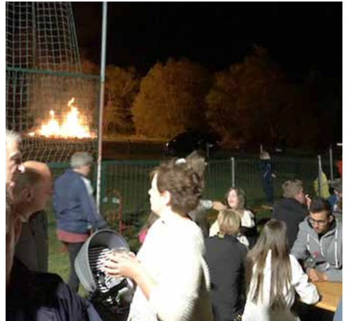
Druženje ob kresu