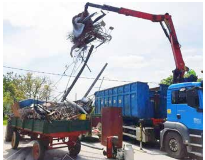
Odvoz nabranega starega železa