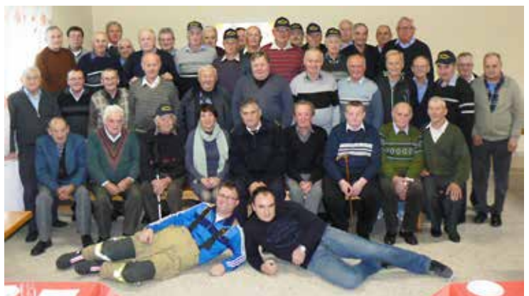
Srečanje z gasilskimi veterani