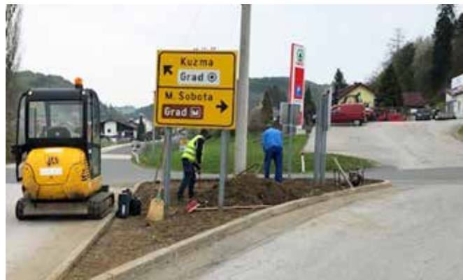
Ureditev križišča v naselju Grad