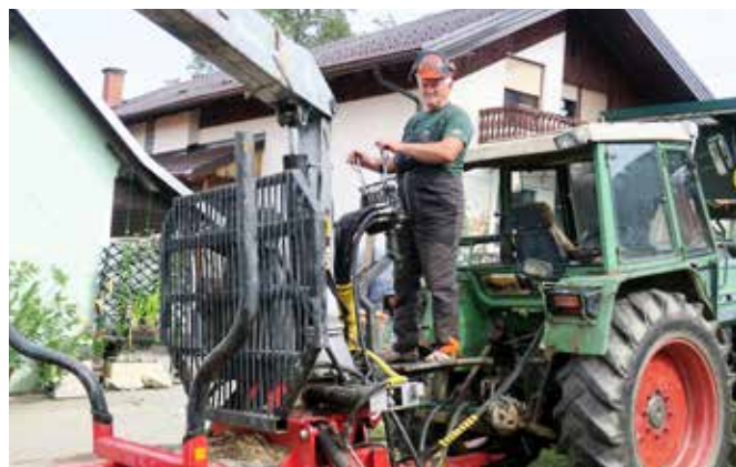
Anton v delavni akciji

Mihaela Žokš, dipl. upr. org. Strokovna sodelavka za družbene dejavnosti