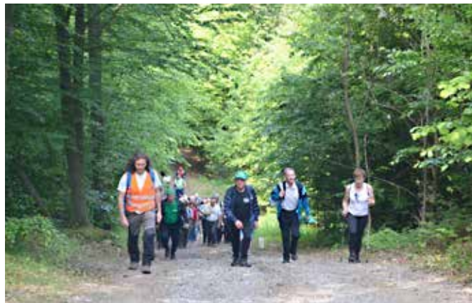
Pohodniki so prispeli do Tromejnika.

da danes meje več ne ločujejo, ampak nam dajejo številne priložnosti za skupno sodelovanje in povezovanje na območju trideželnega parka.