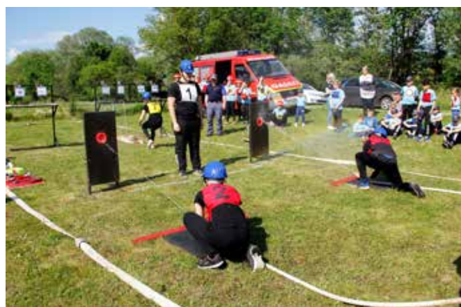
Tekmovanje gasilske mladine

V soboto, 1. 6. 2019, se je v Radovcih in na Dolnjih Slavečih odvijalo gasilsko tekmovanje GZ Grad. Mladinsko gasilsko tekmovanje se je pričelo ob 16. uri na športnem igrišču na Dolnjih Slavečih, kjer je najprej tekmovala gasilska mladina. Sodelovale so 3 pionirske in 2 mladinski ekipe. Pionirji so se pomerili v treh različnih di-