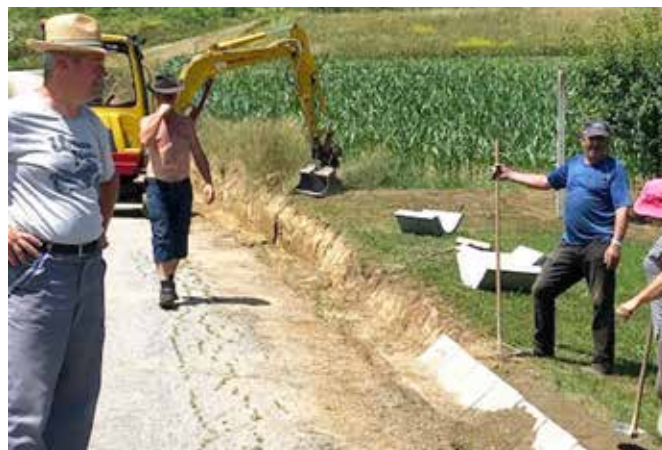
Polaganje kanalet na javni poti v Kovačevcih