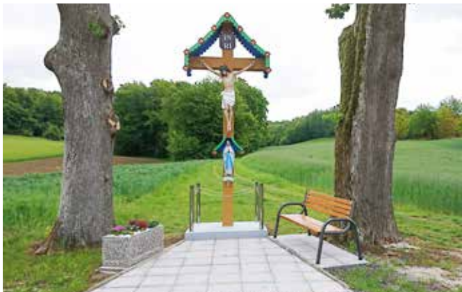
Obnova sakralnega znamenja ob glavni cesti na Dolnjih Slavečih