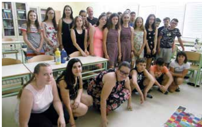
Na delavnici se je vsak lahko izrazil na svoj način