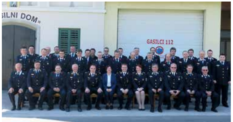
GZ Grad

Gasilska zveza Občine Grad je bila ustanovljena na ustanovni skupščini gasilske zveze 21. 3. 1999 v gasilskem domu Grad. Predsednik iniciativnega odbora za ustanovitev zveze je bil Milan Špilak. Pravico glasovanja na ustanovni skupščini so imeli izvoljeni delegati iz vseh PGD Občine Grad – 14 delegatov.