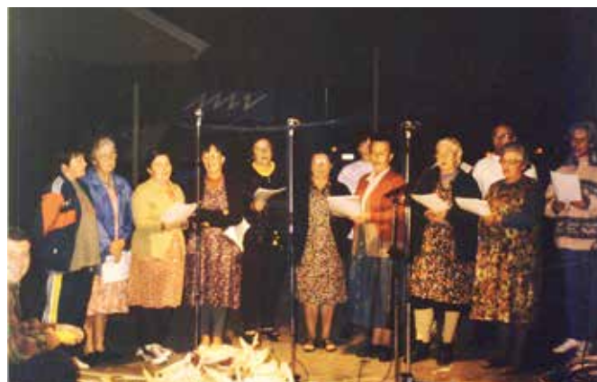
Lüpanje koruze