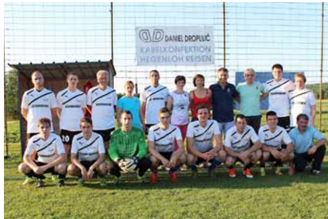
Pod okriljem društva deluje tudi nogometna ekipa.

Člani društva se cel čas svojega delovanja trudijo za razvoj vasi. Zbirajo vaščane ob različnih priložnostih in se družijo. Organizirajo različne prireditve: prireditev ob dnevu žena, tradicionalno bogračijado, nogometne turnirje, miklavževanje. Imajo tudi uspešno nogometno ekipo. Društvo skrbi za ureditev športnega centra in vasi.