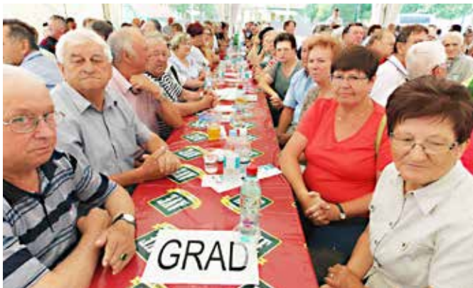
Člani društva se radi udeležijo tudi srečanja pomurskih upokojencev; letos v Moravskih Toplicah.