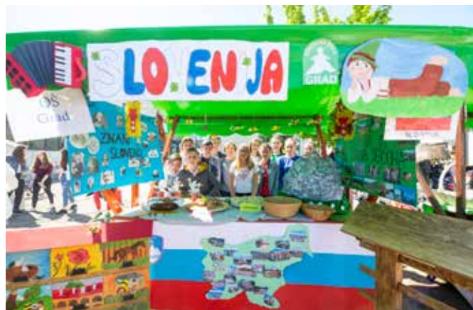
Naša stojnica, okrašena s slovenskimi motivi