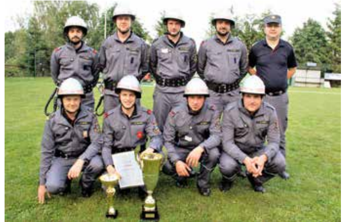
Zmagovalci člani A: PGD Dolnji Slaveči