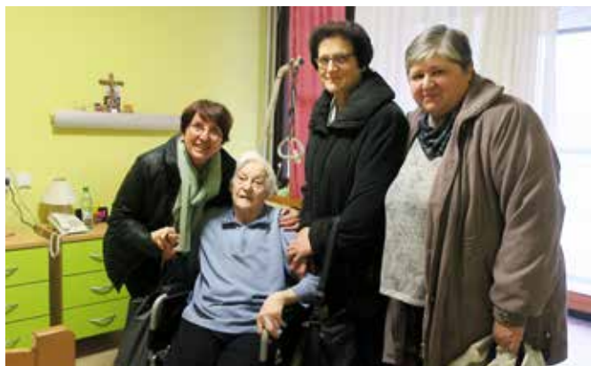
Obisk naših občanov v domovih za ostarele

Mihaela Žokš, dipl. upr. org. Strokovna sodelavka za družbene dejavnosti