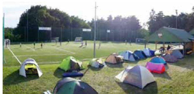
Spanje v šotorih

V naši gasilski zvezi je tudi letos bil organiziran tabor za gasilsko mladino. Gasilski tabor je potekal v Vidoncih v športnem centru. Letošnji tabor je bil nekoliko drugačen. Ne samo, da je potekal v domačem kraju, otroci in mentorji so spali v šotorih pod milim nebom.