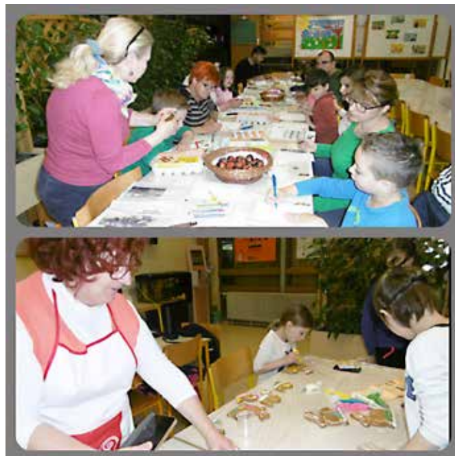
Domača obrt zahteva precej spretnosti