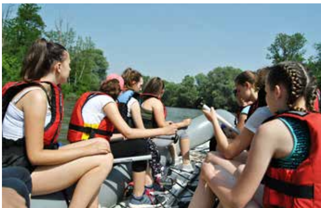
Spust po reki Muri

ki ponosno povabi vse radovedne obiskovalce v notranjost mlina in razloži, kako mlin deluje. Spust smo zaključili na Otoku ljubezni v Ižakovcih.