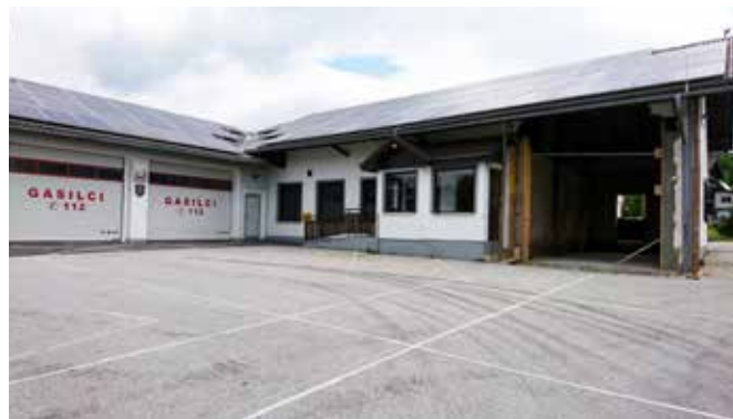
Priprava garaže za novo avtocisterno v Dolnjih Slavečih