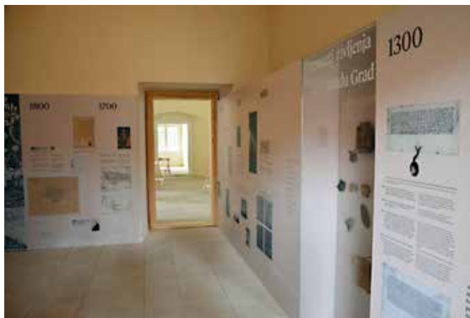
Festival OHS na gradu Grad, predprostor grajske kapele