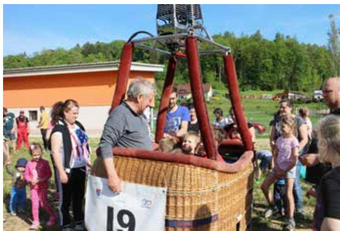
Navdušenje nad balonom