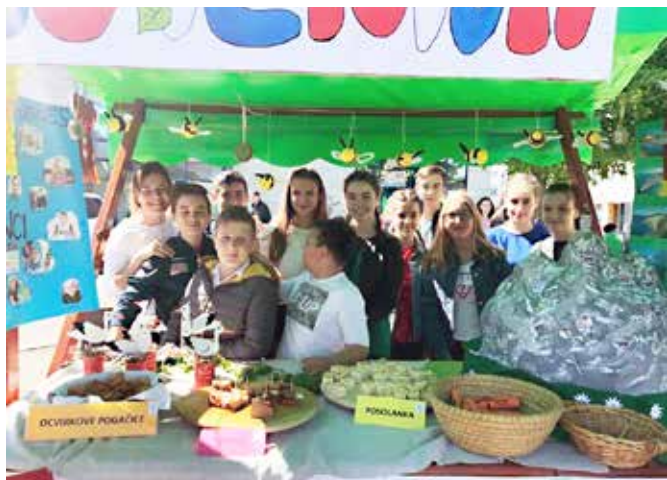
Stojnica z domačimi dobrotami

Kulturni program so popestrili z glasbeno in pevsko točko, kjer sta starejše folkloriste na ljudskih glasbilih spremljala učenca 5. razreda.