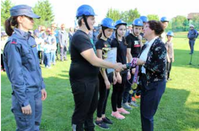
Županja čestita mladim gasilcem iz PGD Motovilci, ki so bili zmagovalci.

sciplinah, in sicer z vajo z vedrovko, s štafeto na 400 m z ovirami in z vajo razvrščanja. Mladinci pa so tekmovali v vaji z ovirami, s štafeto na 400 m z ovirami ter z vajo razvrščanja. V obeh kategorijah so prvo mesto zasedli mladi iz PGD Motovilci.